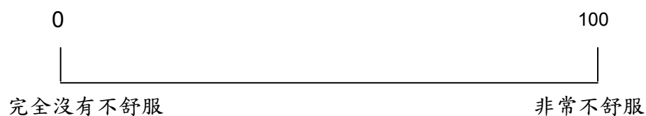
圖一：整體健康狀態 (General Health Status)