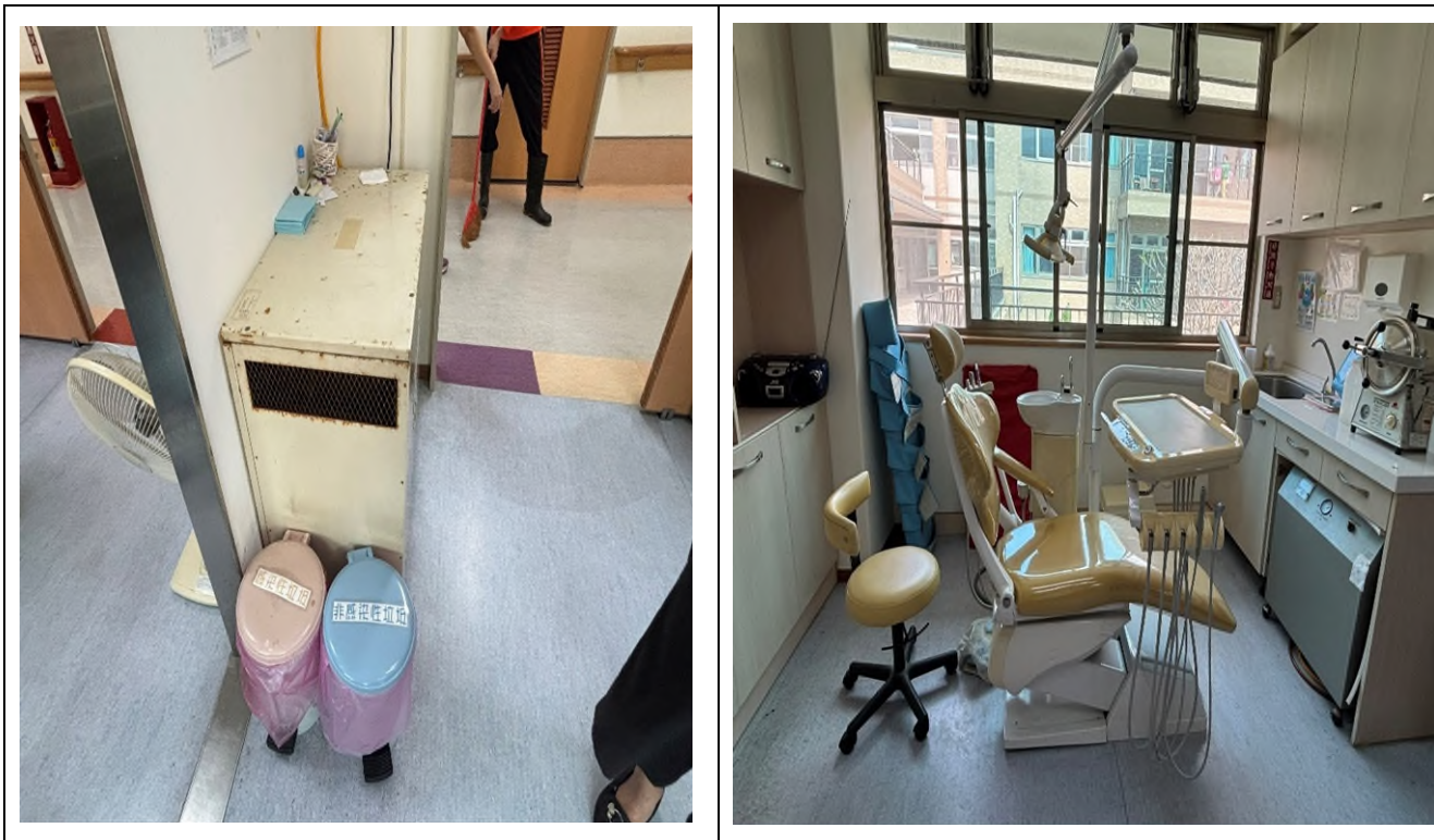
圖 2:林純美組長偕同嘉義縣牙醫師公會張世誠理事長及熊寶貝寵物用品股份有限公司於 113 年 3 月 6 日實地訪視敏道家院