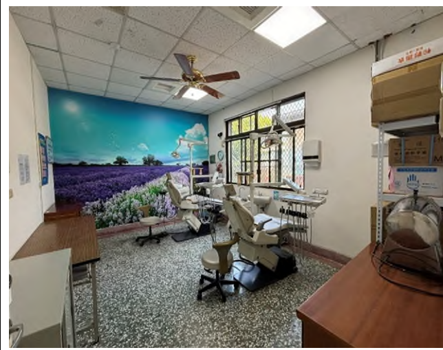
圖 1:林純美組長偕同嘉義縣牙醫師公會張世誠理事長及熊寶貝寵物用品股份有限公司於 113 年 3 月 6 日實地訪視一心教養院