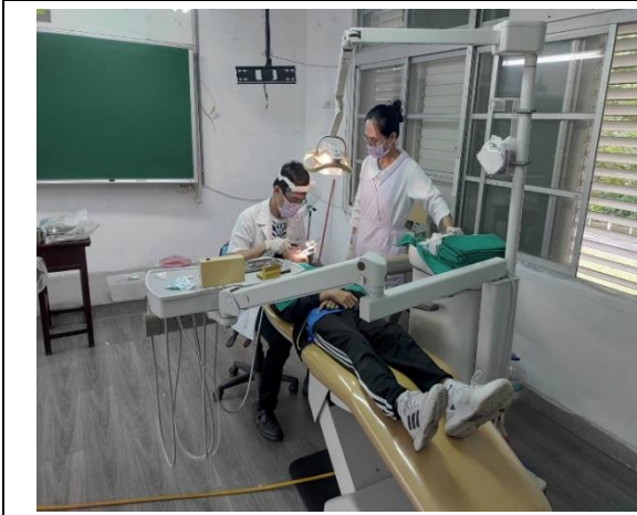
圖：花蓮縣鳳林鎮鳳林國中 2 樓教室，現有牙科診療椅，除了有光源及椅背尚可以調整外，已無其他功能，目前都使用移動式外接醫療設備診療。