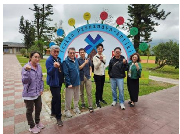
圖：古風國小 114 年 3 月 28 日實地勘查