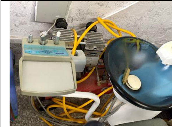
圖：開診前之前置作業(花蓮縣鳳林國中)