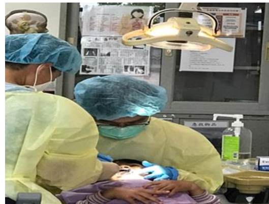
圖：卓溪鄉古風國小健康中心看診情形