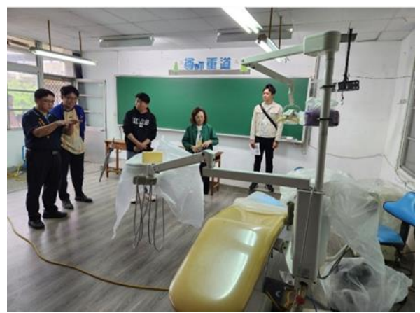
圖：鳳林國中 114 年 3 月 28 日實地勘查