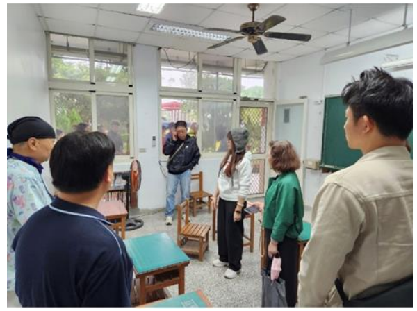
圖：豐裡國小 114 年 3 月 28 日實地勘查