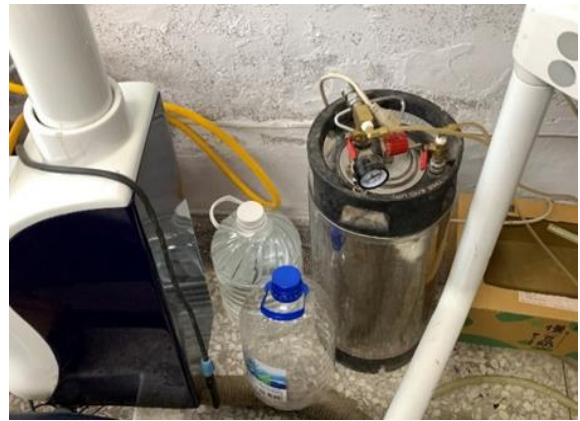
圖：開診前之前置作業(花蓮縣鳳林國中)