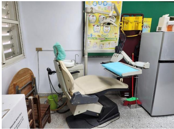
圖：豐裡國小 114 年 3 月 28 日實地勘查