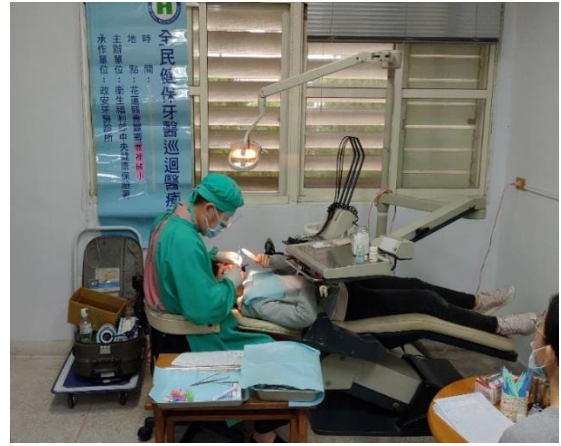
圖：花蓮縣壽豐鄉豐裡國小健康中心，現有牙醫診療椅，除了有光源及椅背尚可以調整外，已無其他功能，目前都使用移動式外接醫療設備診療。