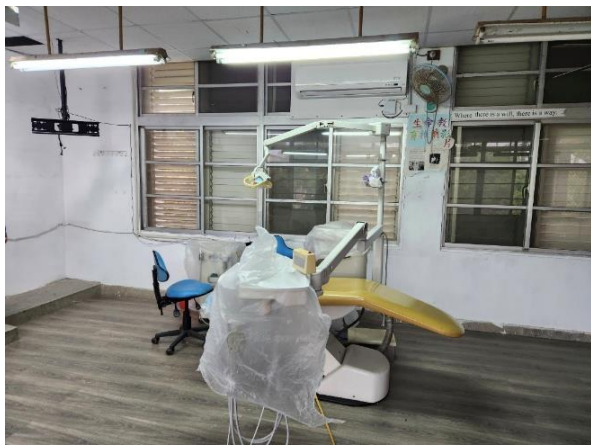
圖：鳳林國中 114 年 3 月 28 日實地勘查