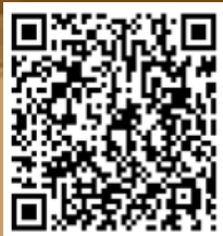
手機快速認證教學影片